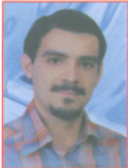
گردآوری و تنظیم: مهندس مهدی ریزوندی، مسئول نرم افزار و طراحی سیستم